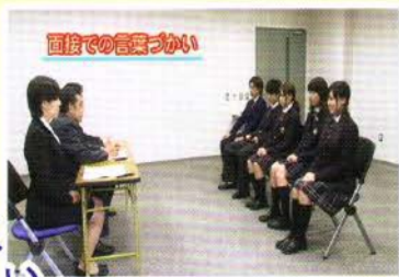
面接での言葉づかい