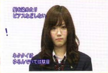
面接の心構え ピアスなどはない