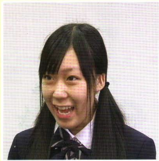
面接の心構え ゆるみではない