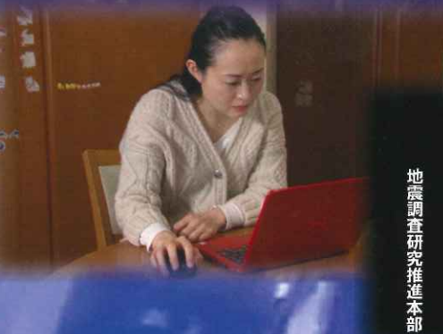
地震調査研究推進本部